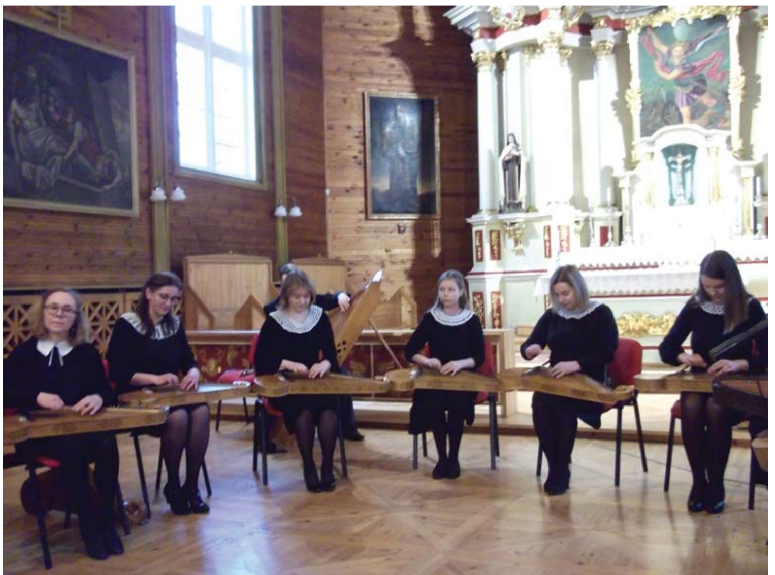
Koncerto Svėdasuose akimirka.

Į 2018 m. sukurtą Šimtmečio svėdasiškių portretų galeriją, dvi dešimtys jos paveikslų nuolat eksponuojami Svėdasų miestelio bibliotekoje, pateko abu minėti kultūros žiburiai. Smagu būtų, jei pavyktų kanklininkų orkestrėlį atkurti ir Svėdasuose, atgaivinti užgesusią tradiciją.